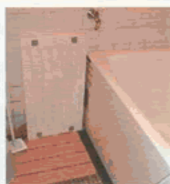
ジメジメ…、湿気の バス