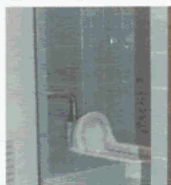
古くなった 和式のトイレ