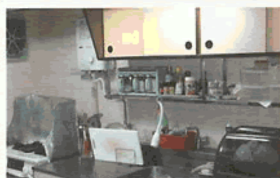
収納不足で、かたづけられない キッチン